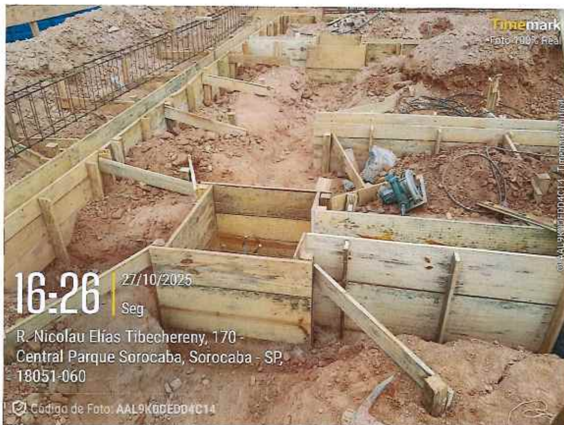
Execução de forma de viga baldrame