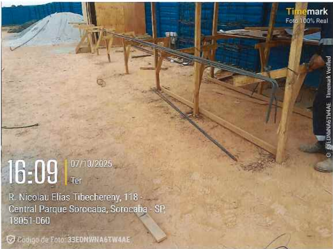
Arrasamento de estacas

752 | CONSTRUÇÃO UBS CENTRAL PARQUE | | CE | 002/2025