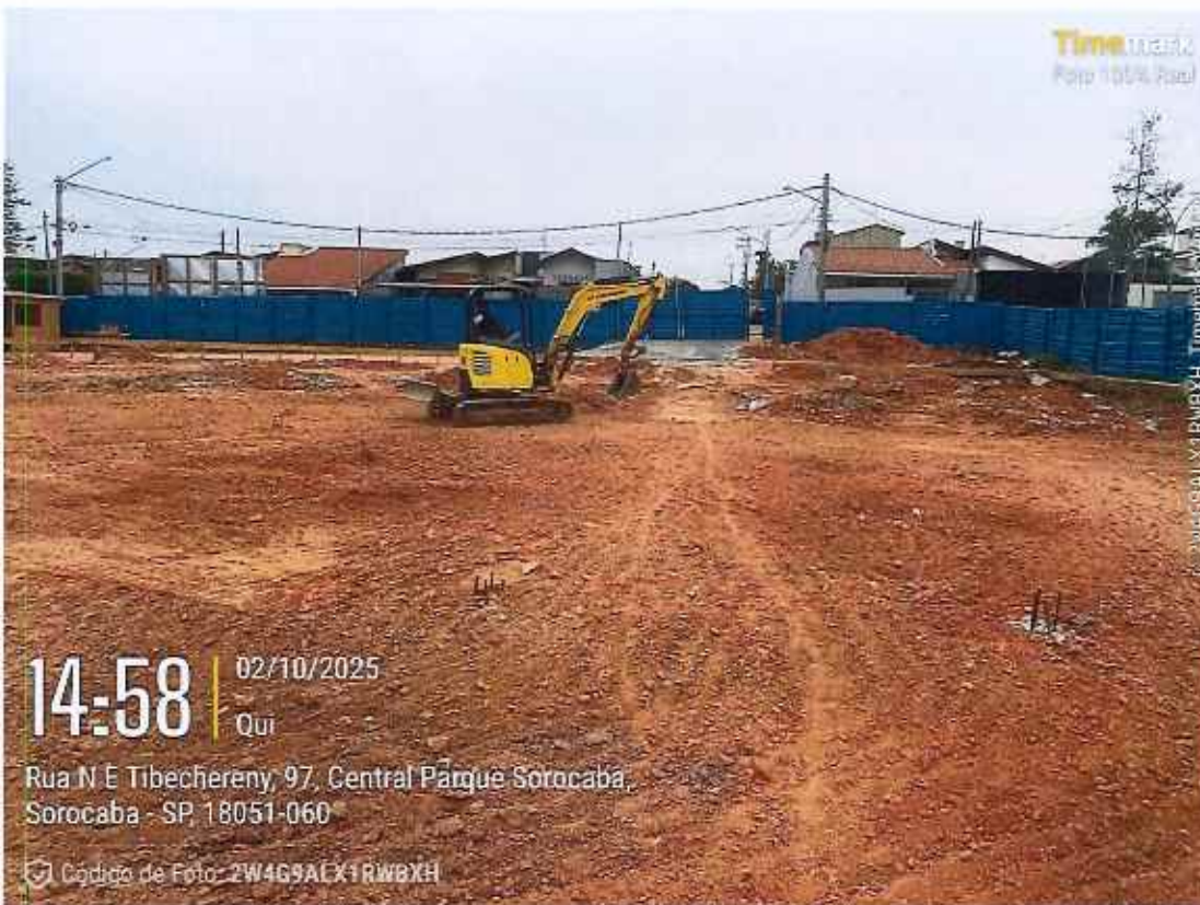
Armadura de ferragens de baldrame

752 | CONSTRUÇÃO UBS CENTRAL PARQUE | | CE | 002/2025