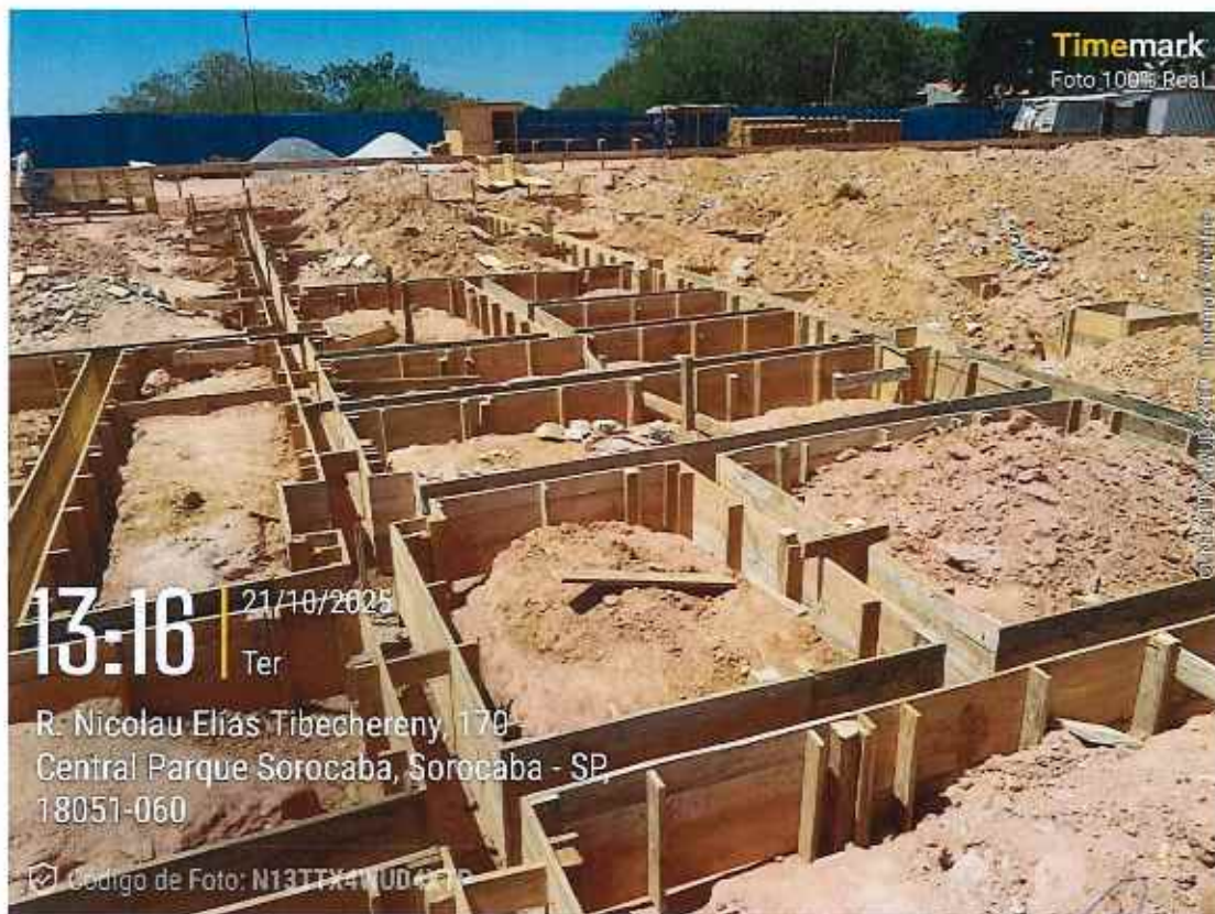
Execução de forma de vigas balcrame

752 | CONSTRUÇÃO UBS CENTRAL PARQUE | | CE | 002/2025