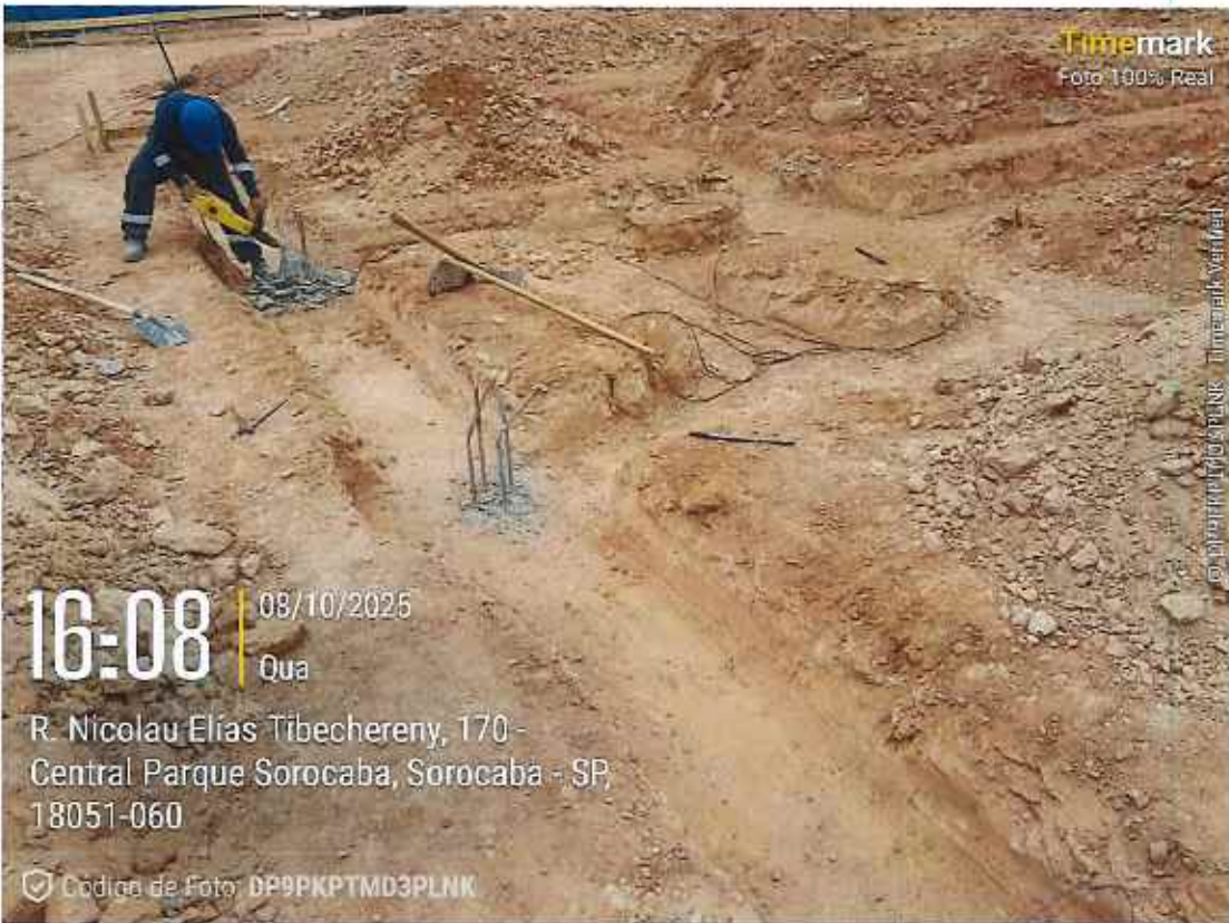
Armação de ferragens de vigas baldrame

752 | CONSTRUÇÃO UBS CENTRAL PARQUE | | CE | 002/2025