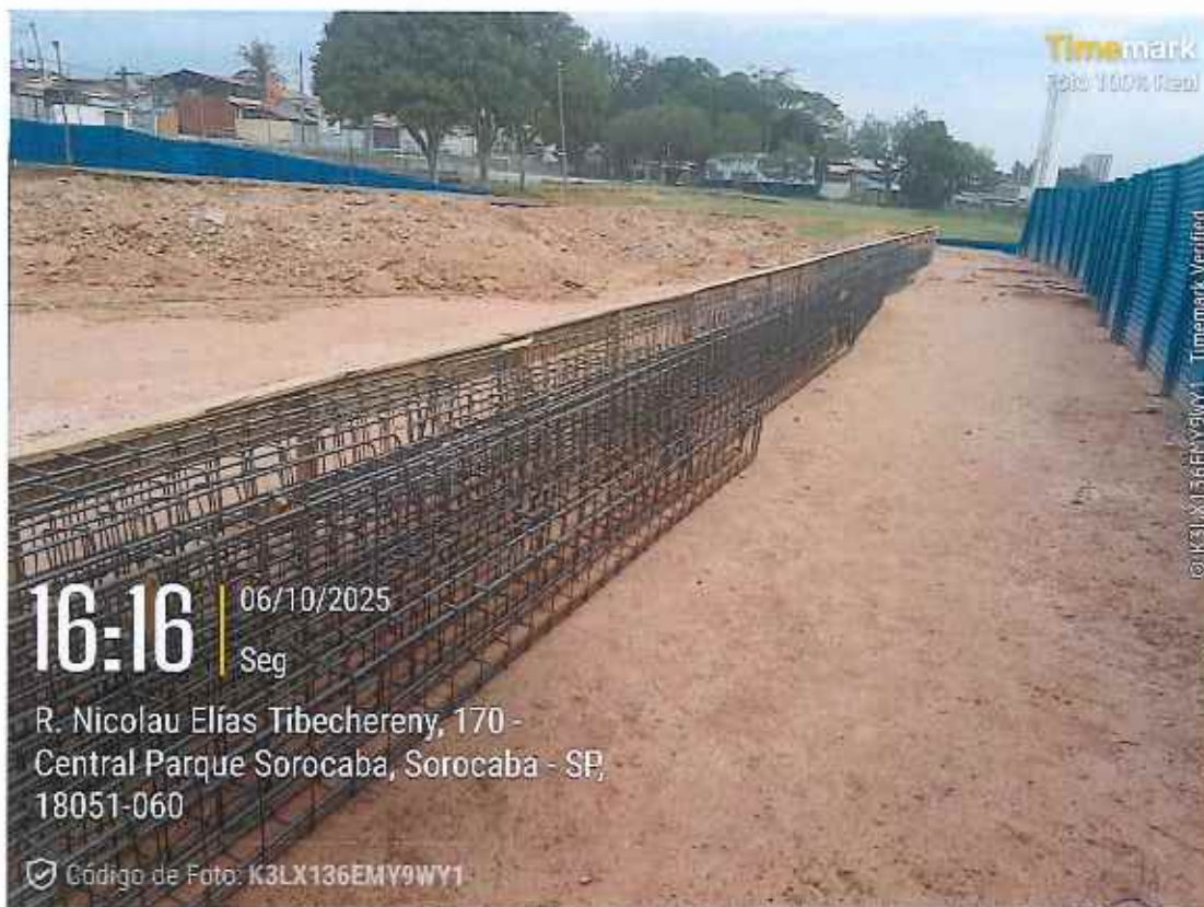
Armação de ferragens de vigas balcrame

752 | CONSTRUÇÃO UBS CENTRAL PARQUE | | CE | 002/2025