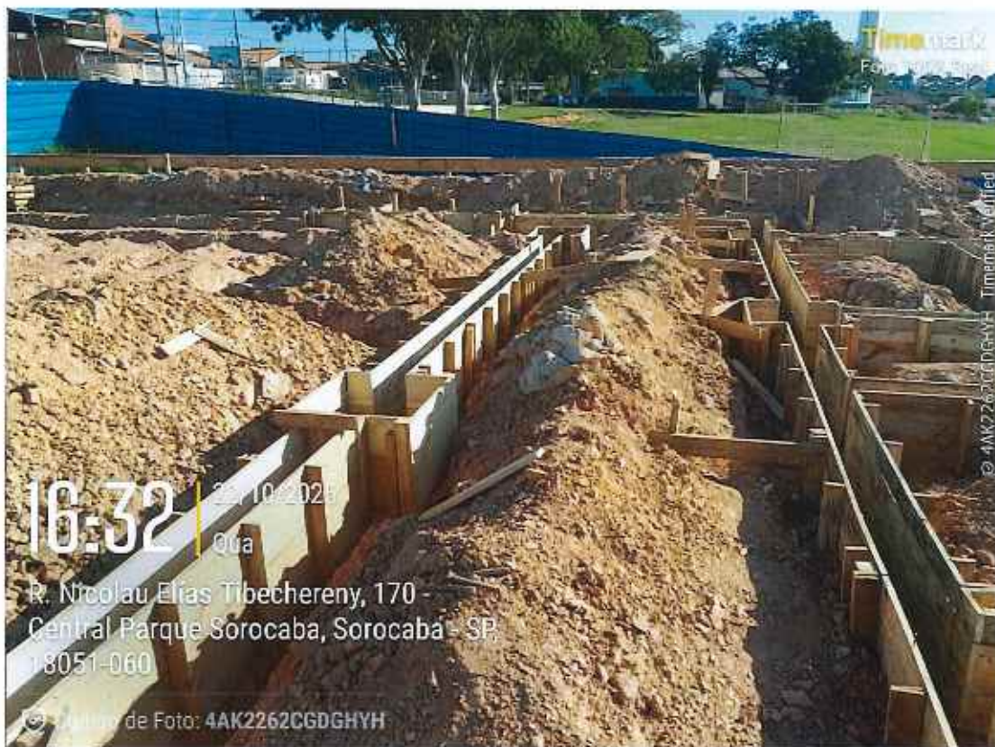
Execução de forma de vigas baldrame

752 | CONSTRUÇÃO UBS CENTRAL PARQUE | | CE | 002/2025