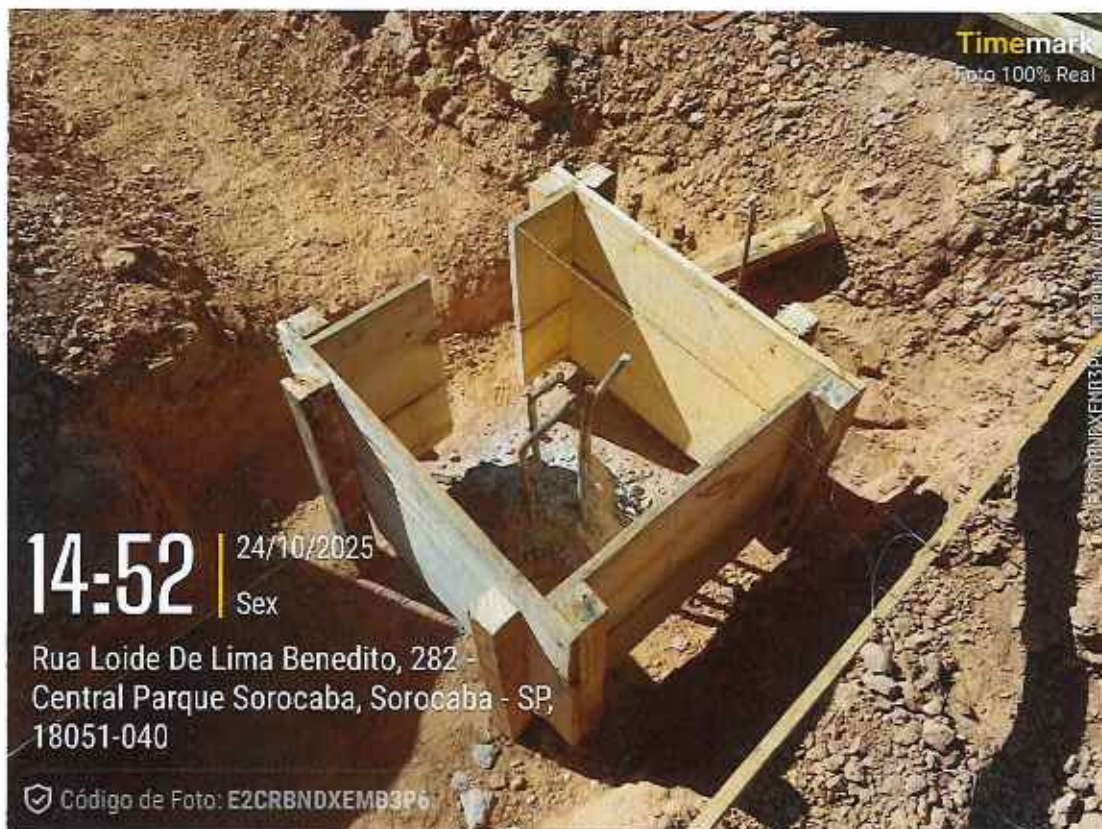
Armação de ferragens e formas de vigas baldrame

752 | CONSTRUÇÃO UBS CENTRAL PARQUE | | CE | 002/2025