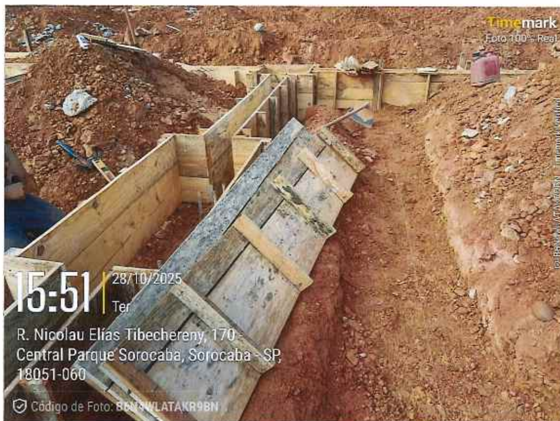
Execução de forma de viga baldrame