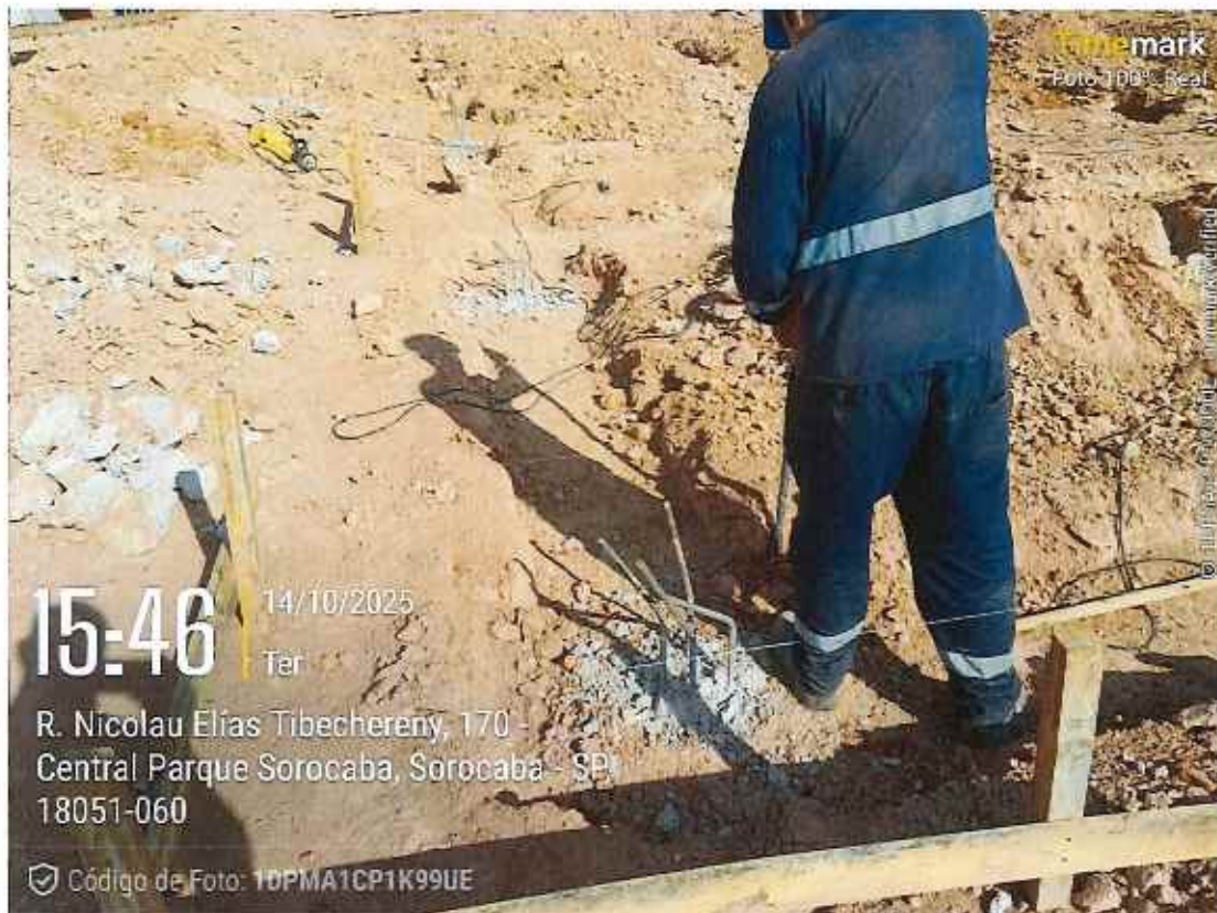
Execução de formas de vigas baldramés

752 | CONSTRUÇÃO UBS CENTRAL PARQUE | | CE | 002/2025