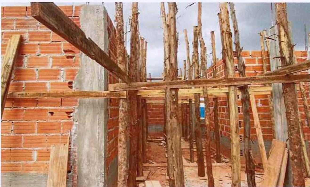
09/02/2026 - Execução de escoramento de laje