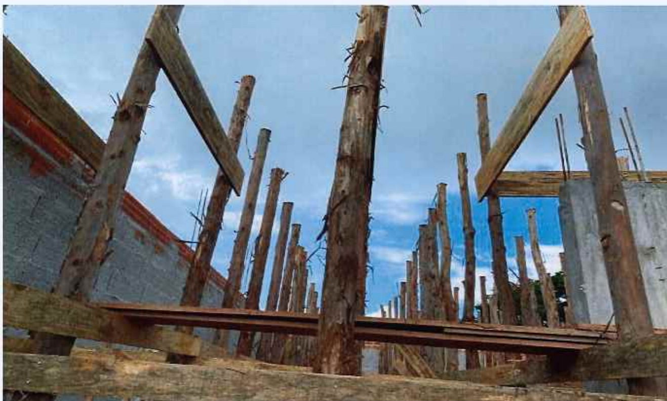
12/02/2026 - Escoramento de laje