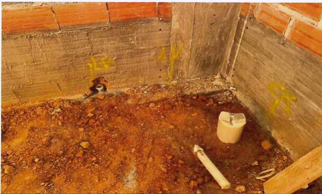
24/02/2026 - Execução de hidráulica