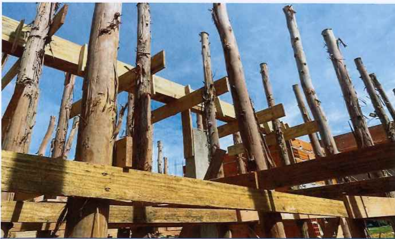
19/02/2026 - EXECUÇÃO DE FORMA DE VIGA DE COBERTURA