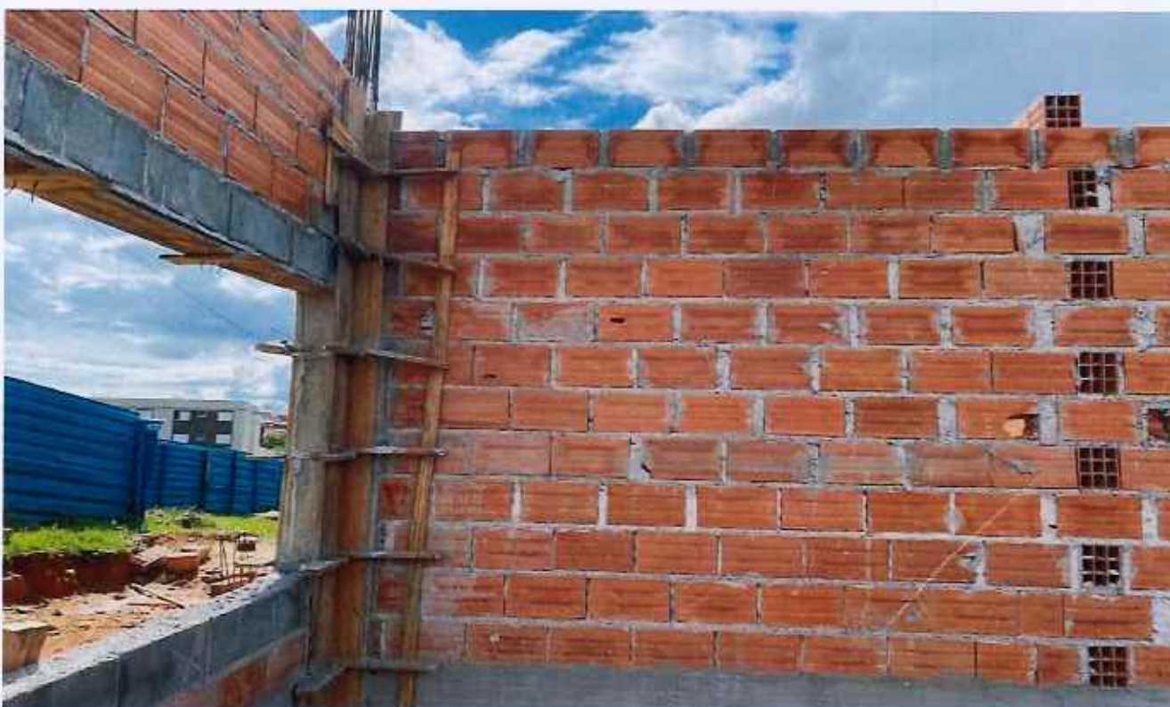
03/02/2026 - Concretagem de pilar