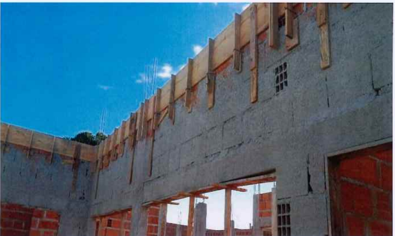
16/02/2026 - Execução de viga de cobertura