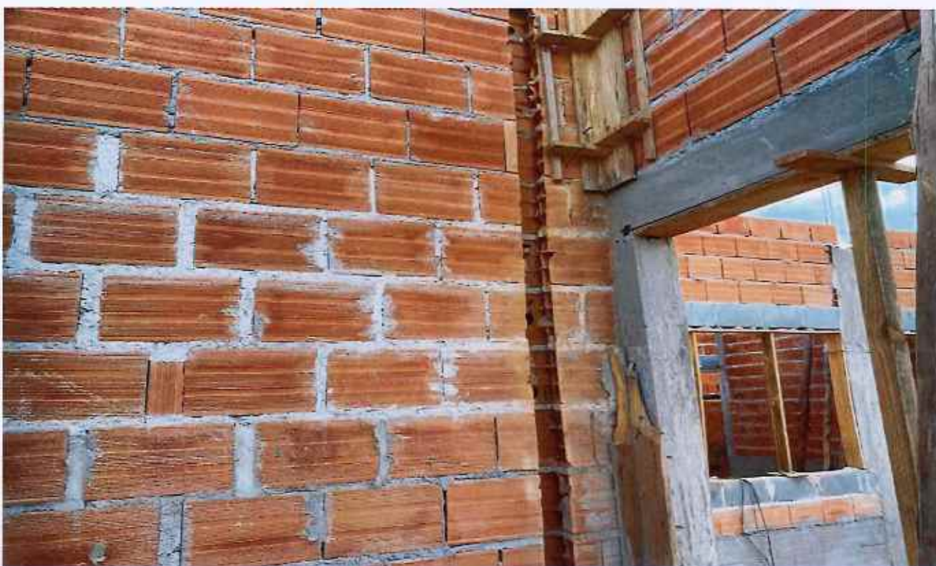
05/02/2026 - Execução de ventilação de esgoto