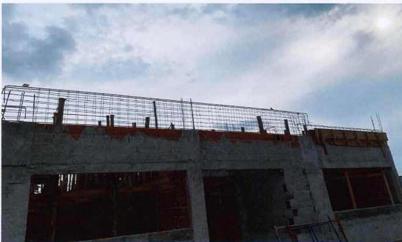
25/02/2026 - Instalação de armadura de vigas de cobertura