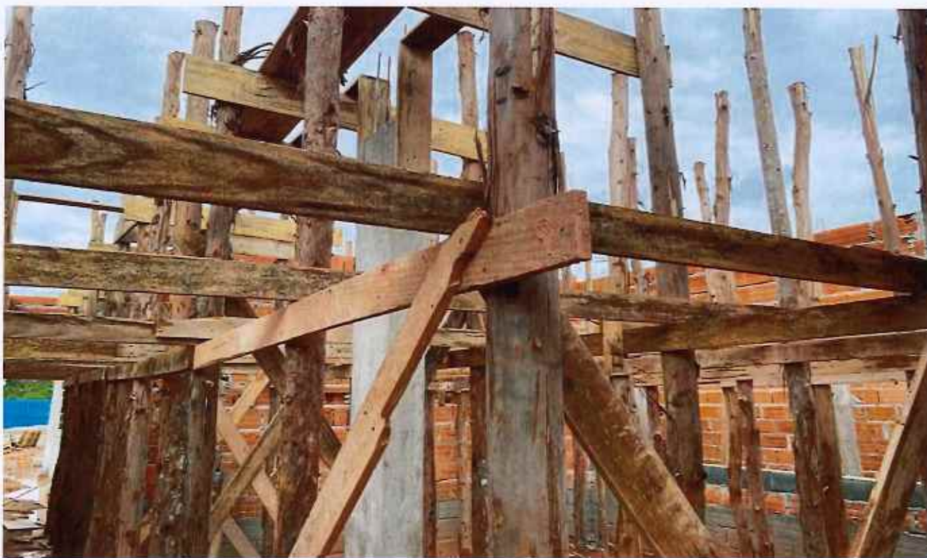
11/02/2026 - Execução de escoramento de laje