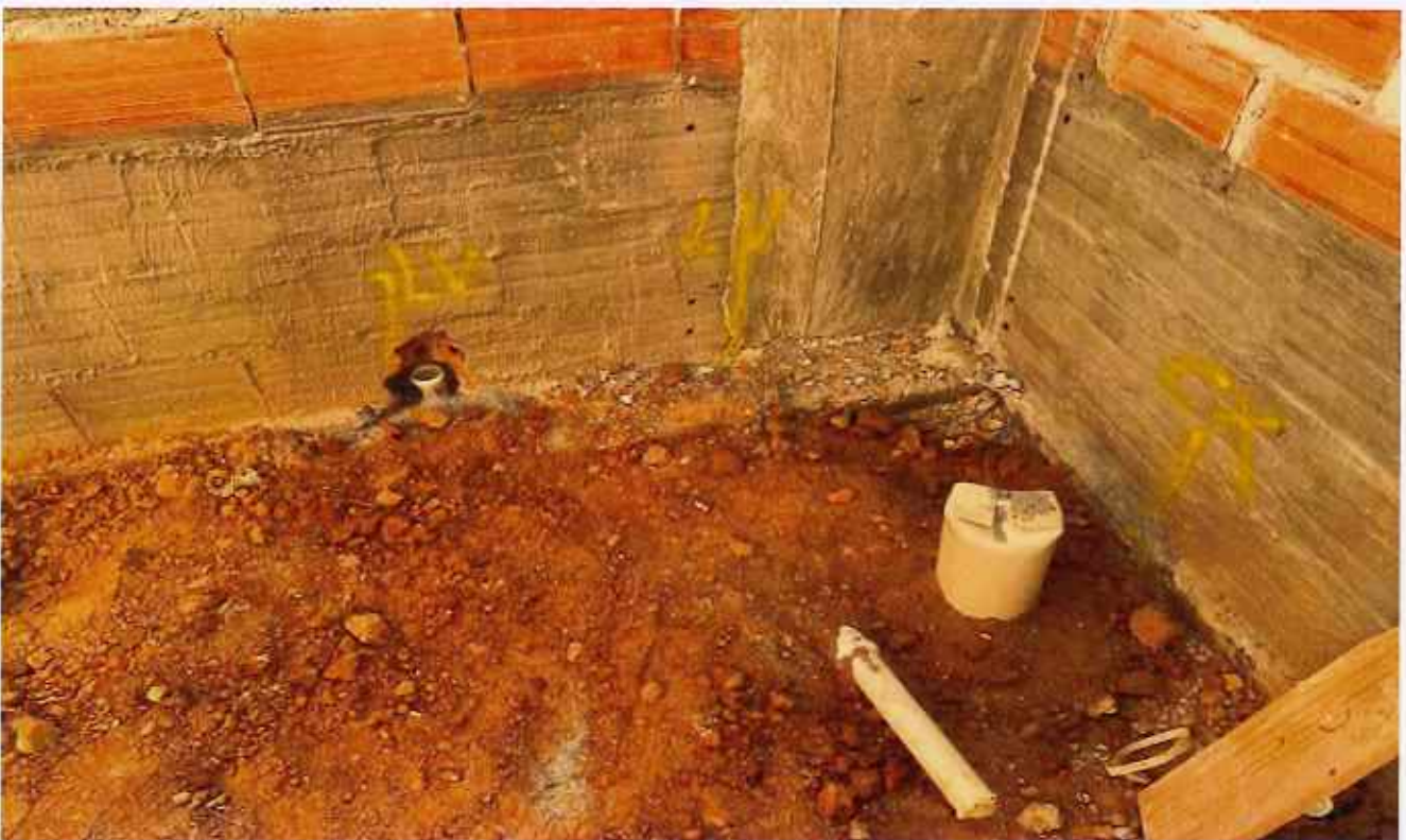
24/02/2026 - Execução de hidráulica