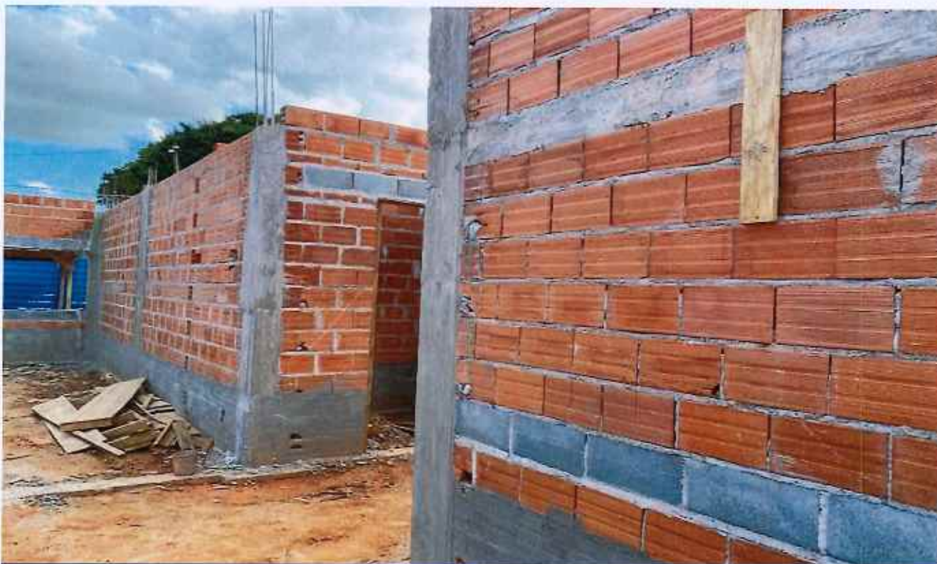
04/02/2026 - Desforma de pilar