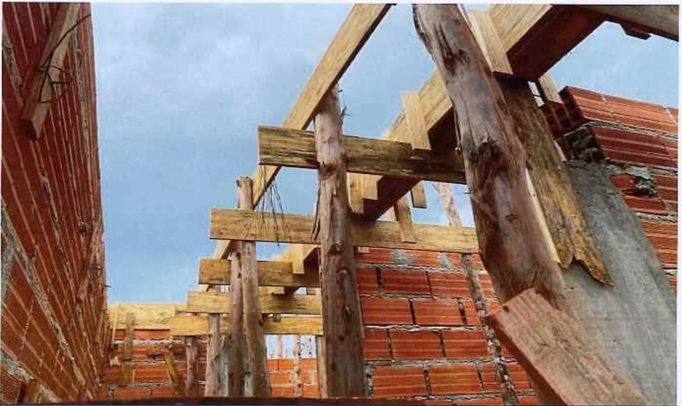
23/02/2026 - EXECUÇÃO DE FORMA DE VIGA DE COBERTURA