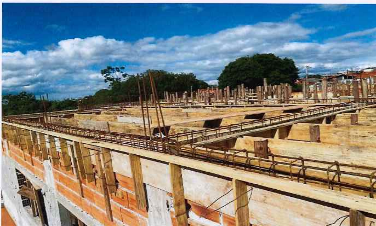
27/02/2026 - EXECUÇÃO DE FORMA PARA MONTAGEM DE LAJE

VIGENT CONSTRUÇÕES LTDA - CNPJ: 15.320.722/0001-09