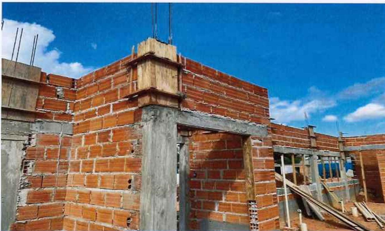
06/02/2026 - Desforma de pilar