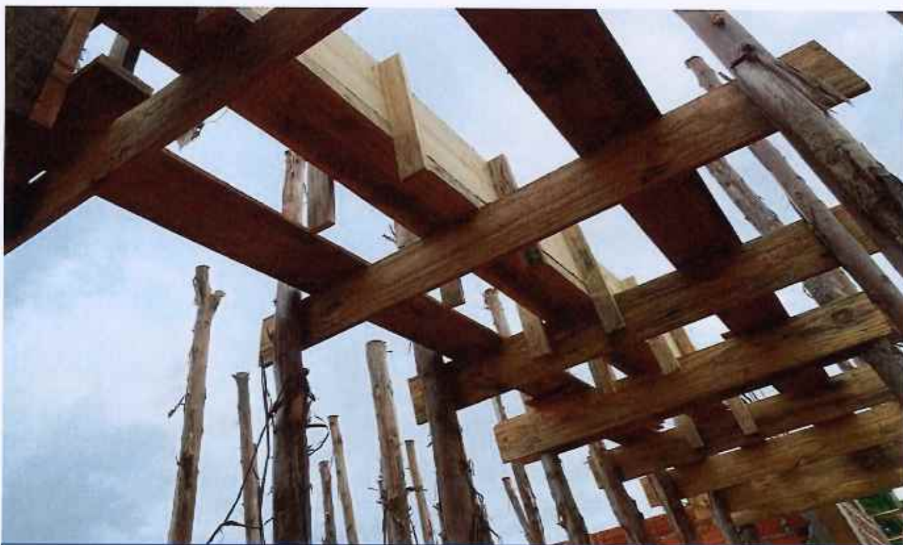
26/02/2026 - EXECUÇÃO DE FORMA DE VIGA DE COBERTURA