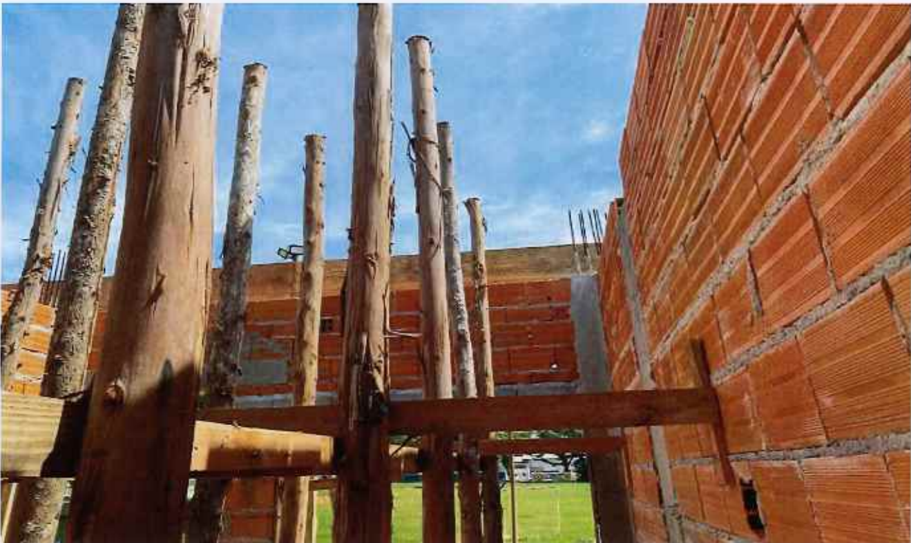
20/02/2026 - EXECUÇÃO DE FORMA DE VIGA DE COBERTURA